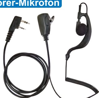
OEM HD-02 (PR2746)