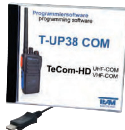
T-UP38 PMR (PR2429) T-UP38 COM (PR2430)

verstellbarer Kopfhörer mit Schwanenhals-Mikrofon und separater PTT Sendetaste